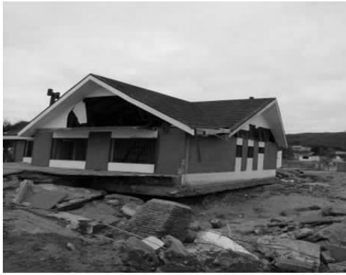
(a) 海岸线 50m 一建筑物