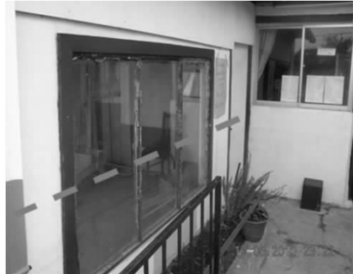
(b) 海岸线 500m 海啸爬高迹线